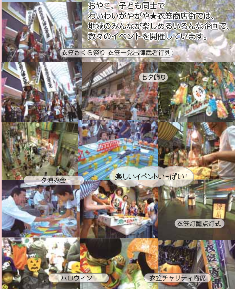
衣笠さくら祭り 衣笠一党出陣武者行列

おやこ、子ども同士でわいわいがやがや★衣笠商店街では、地域のみんなが楽しめるいろんな企画で、数々のイベントを開催しています。